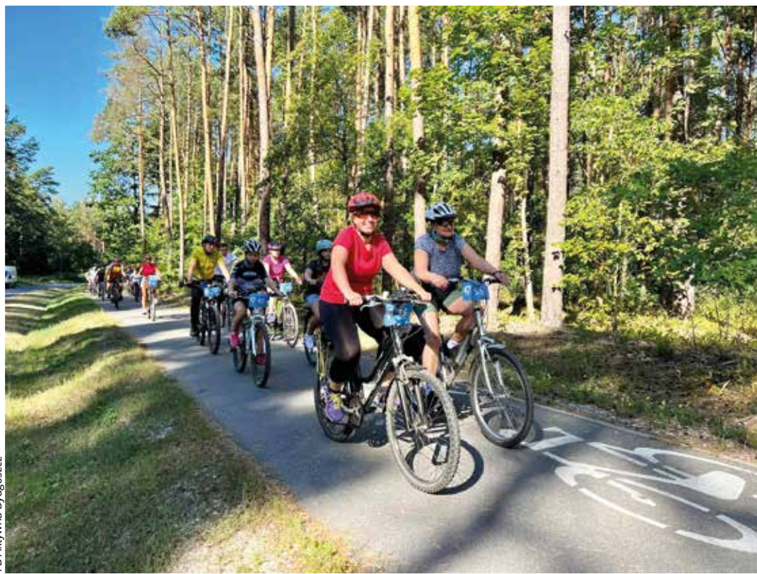
FB Aktywna Bydgoszcz

Tydzień Zrównoważonej Mobilności, który trwał od 16 do 22 września, zainaugurował przejazd rowerowy z Bydgoszczy od ul. Mostowej do boiska w Murowańcu przy ul. Staroszkolnej. Kolarze i kolarki wystartowali o godz. 10:00.