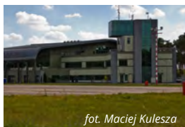
fol. Maciej Kulesza