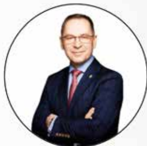
Ambasador NSP 2021 WÓJT GMINY BIAŁE BŁOTA DARIUSZ FUNDATOR