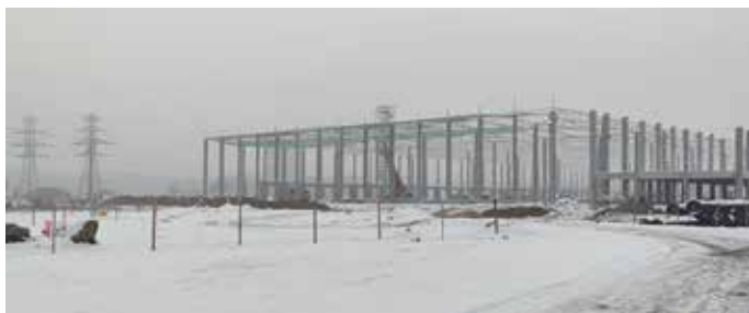
Pierwsza z trzech hal magazynowych Panattoniego w Lisim Ogonie

Wygląda na to, że nie będą to ostatnie inwestycje tego typu, biorąc pod uwagę zapytania ofertowe kierowane pod adresem gminy przez kolejnych, potencjalnych inwestorów. ■■