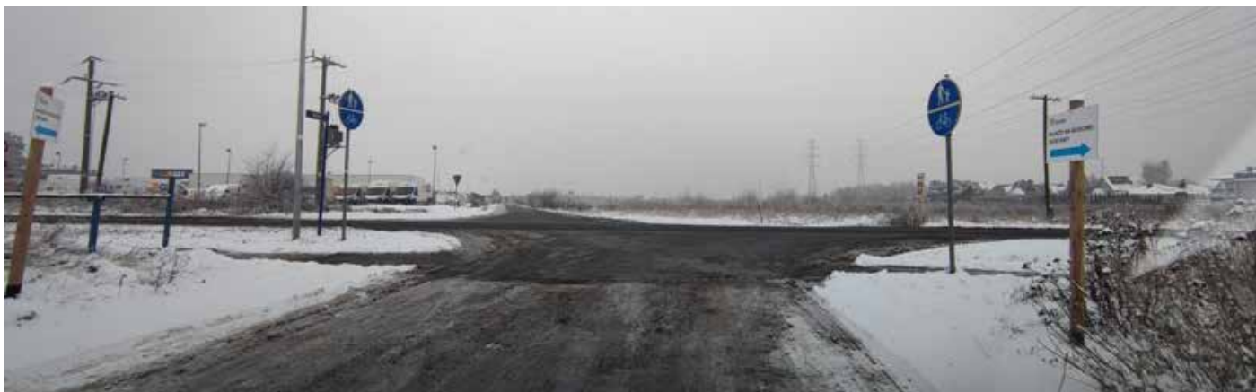
Planowane i realizowane gminne inwestycje - lokalizacja przyszłego ronda u zbiegu ulic Wiejskiej i Potulickiej w Lisim Ogonie

Mnogość prac i projektów inwestycyjnych skłania do syntetycznego przekazania informacji o tym, co dzieje się na terenie gminy. Z przeglądu ogłaszanych i rozstrzygniętych już przetargów wynika, że Nowy Rok w Gminie Białe Błota zapowiada się dość dynamicznie.