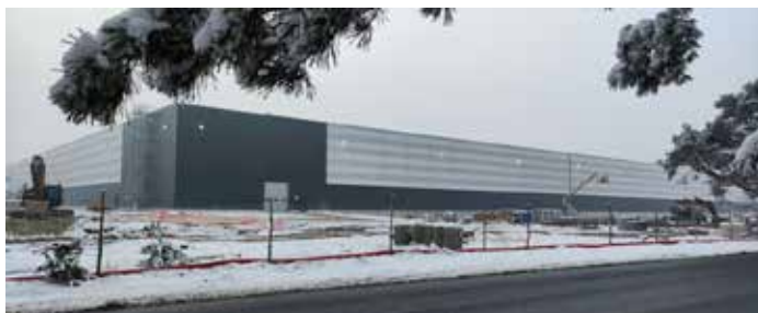
Obiekt wznoszony przez Hillwood w Przyłękach