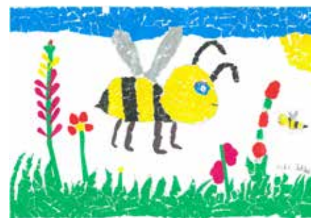
2 miejsce Wiktorria Tatka, Łochowo, 8 lat