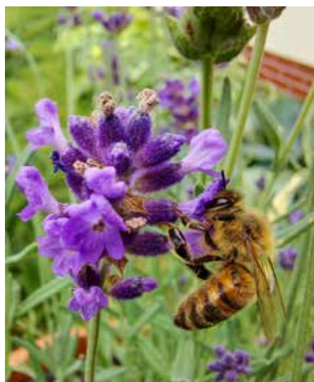
1 miejsce Katarzyna Łukasiewicz, Murowaniec