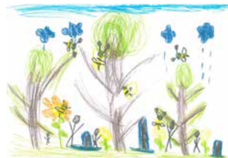
3 miejsce Franciszek Baumgart, Białe Błota, 7 lat