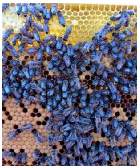
2 miejsce Oliwia Wojciechowska, Łochowo 11 lat