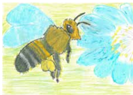
1 miejsce Wiktorria Filipczak, Łochowo, 8 lat

Motywy pełne kwiatów, pasiek i pszczół znalazły więc swoich odkrywców, zachwycając kunsztem i wrażliwością na piękno szczegółu. ■■