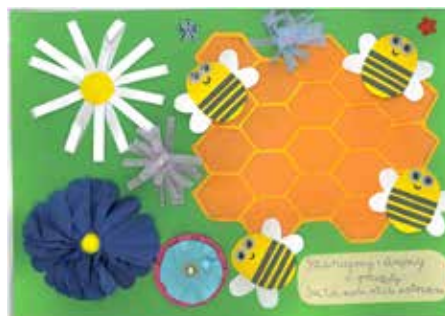
2 miejsce Oliwia Klomfas, Białe Błota, 9 lat